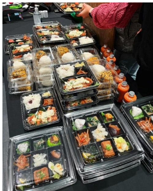
TATSUSHI 日本人が営む日本食レストラン「TATSUSHI」