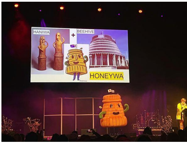
Introducing Honeywa, the 'yurukyara' mascot by Wellington Sakai Association ウェリントン堺協会による同協会のゆるキャラ 「HONEYWA」の紹介