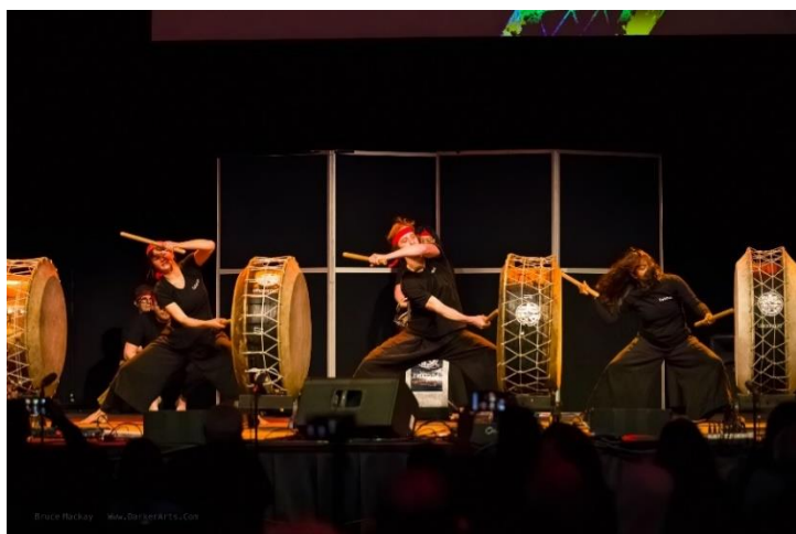
Taiko Drumming by Taikoza Wellington 太鼓座ウェリントンによる太鼓演奏