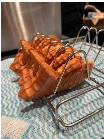
JETAA Wellington Taiyaki JETAAウェリントン支部の鯛焼き