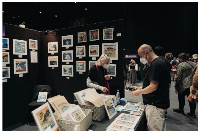
Wellington in The Style of Hiroshige 歌川広重風の絵画作品