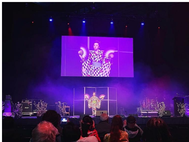
Koten Classical Japanese Dance by Koten Dance Group 古典ダンスグループによる日本舞踊