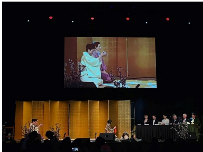
Tea ceremony by Wellington Omotesenke Sado Club ウェリントン表千家茶道クラブによる茶道デモン レーション