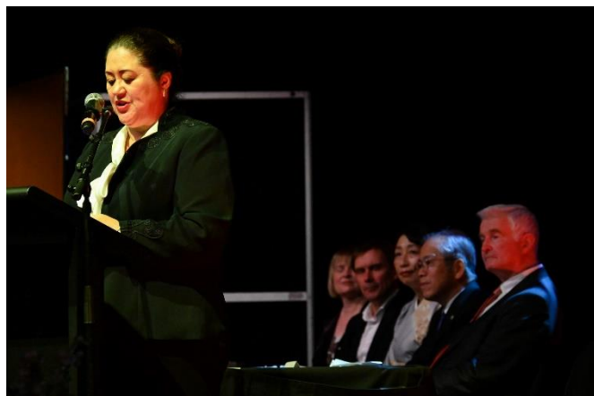
Speech by Her Excellency The Rt Honourable Dame Cindy Kiro シンディ・キロ総督の御挨拶