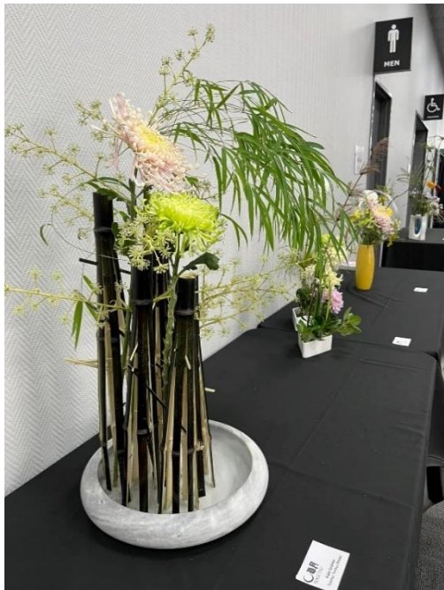
Ikebana Exhibition – Sogetsu School 草月グループの生け花作品展示