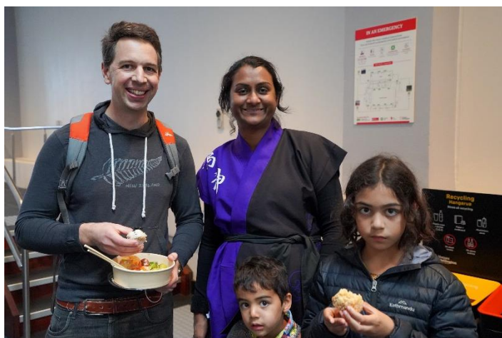
Visitors enjoying Japanese food 日本食を楽しむ来場者