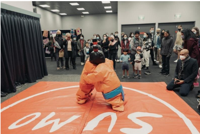
Kids having fun experiencing sumo 相撲体験を楽しむ子供たち