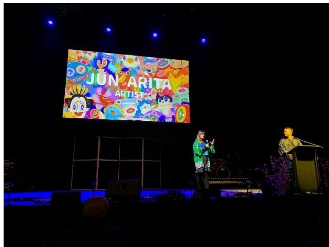
Live drawing of "Yokai (supernatural monsters)" by Artist and illustrator Jun Arita アーティスト兼イラストレーターの有田潤氏による妖怪ライブアート