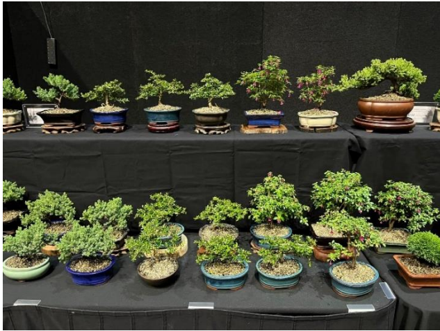
Bonsai on display at 'MiniGardens Bonsai NZ' 「MiniGardens Bonsai NZ」の盆栽展示