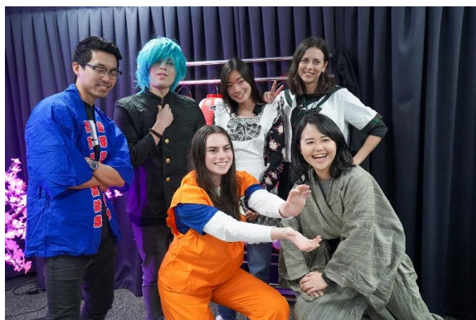
Visitors in anime costumes アニメ・コスチュームを着た来場者