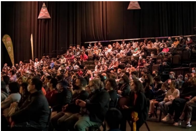
The audience enjoying the main stage performances メイン・ステージの公演を楽しむ観客