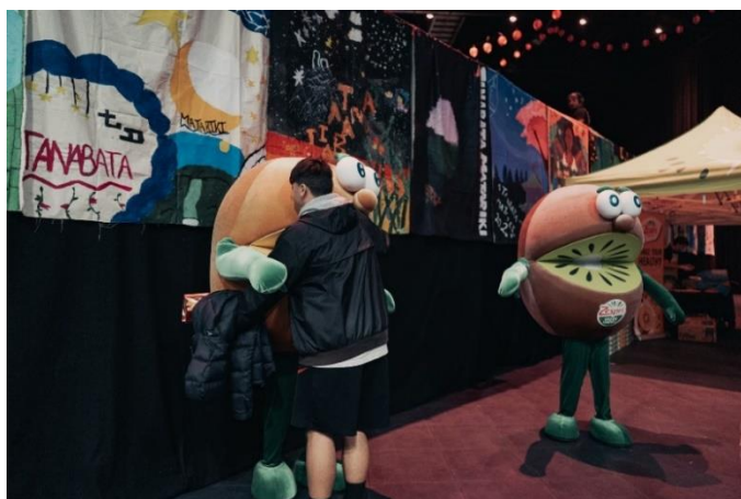
Hugging Zespri's Kiwi Brothers ゼスプリのキウイ・ブラザーズとのふれあい体験