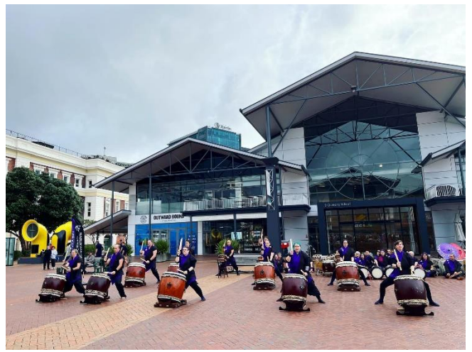
Narukami Taiko Performance 鳴神太鼓の演奏