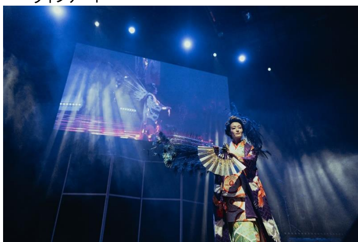
Neo Kimono Style Fashion Show by Essence of Japan エッセンス・オブ・ジャパンによる新派着物スタイルのファッション・ショー