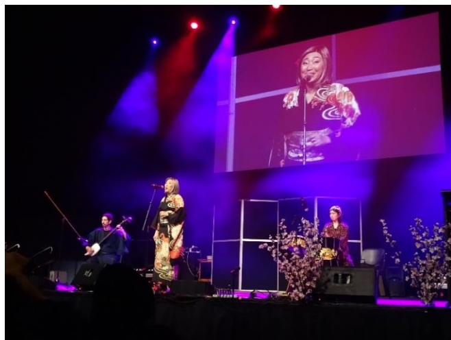
'Akane' performing regional folk songs and the chanting of Japanese poetry, 'Shigin', backed by the Tsugaru shamisen and the Japanese drum 民謡・詩吟グループ「紅音(Akane)」の演奏