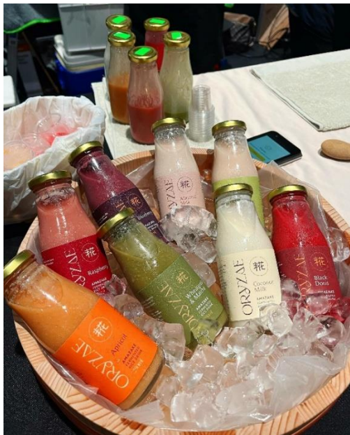
Oryzae Amazake 日本人御夫婦の甘酒メーカー「Oryzae」