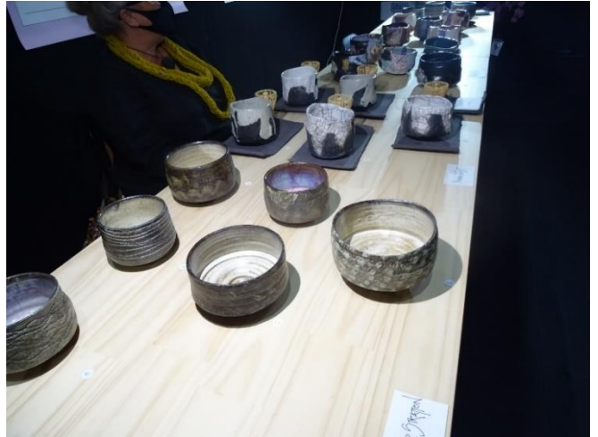
Pottery works on display at 'Tea Ware – Aotearoa' 「Tea Ware-Aotearoa」の陶芸作品展示