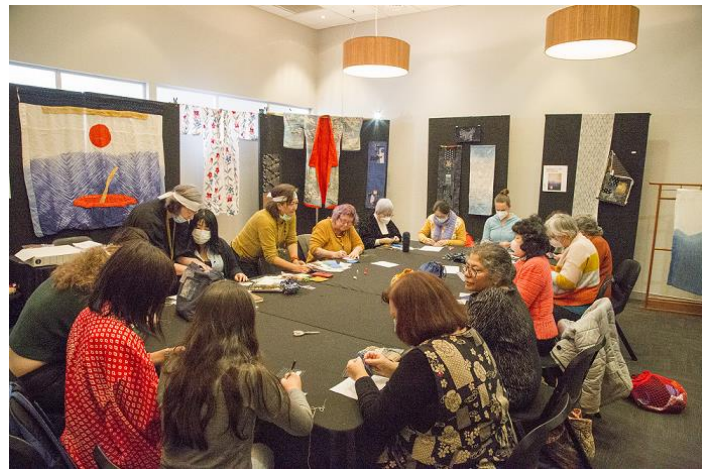
Sashiko (Japanese embroidery) Exhibition and Workshop 刺し子の展示及びワークショップ