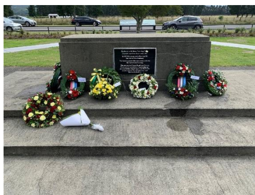
Wreath laying at the camp memorial 収容所慰霊碑への献花