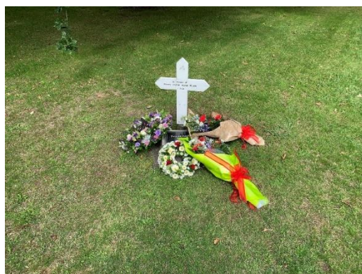
Wreath laying for the New Zealand victim NZ人犠牲者への献花