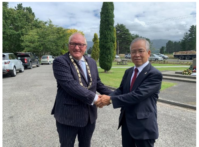
Photo with Mayor Alex Beijen of South Wairarapa District (left) アレックス・ベイエン南ワイララパ市長(左)との写真