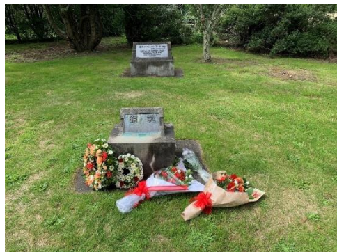
Wreath laying for the Japanese victims 日本人犠牲者への献花