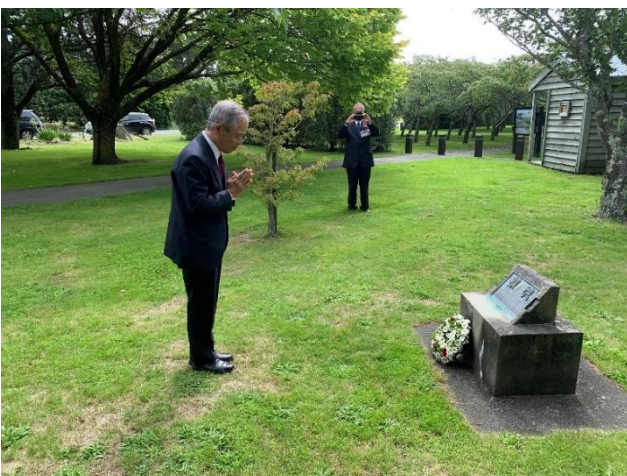
Wreath laying for the Japanese victims 日本人犠牲者への献花